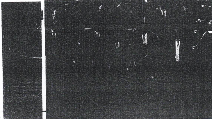
Lula desce do tablado onde se reuniram para a foto oficial da cúpula os chefes de Estado e governo ibero-americanos, em Santiago