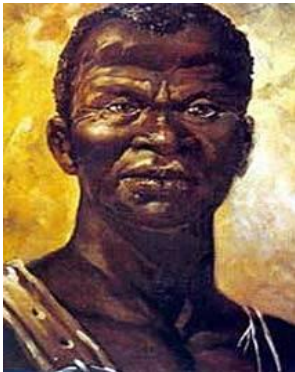
Zumbi dos Palmares: líder do Quilombo dos Palmares

O negro, porém reagiu à escravidão, buscando uma vida digna. Neste período eram comuns as revoltas nas fazendas em que grupos de escravos fugiam, formando nas florestas os quilombos. Estes quilombos eram comunidades organizadas, onde os integrantes viviam em liberdade, através de uma organização comunitária aos moldes do que existia na África. Nos quilombos, os negros africanos podiam praticar sua cultura, falar sua língua e exercer seus rituais religiosos. O mais famoso foi o Quilombo de Palmares, comandado por Zumbi.